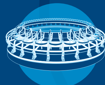
DeLaval konventionella mjölkningssystem