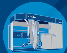
DeLaval VMS® Serien